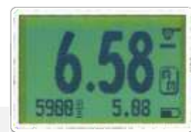
Modo de pantalla simple con dígitos grades para una fácil visualización.