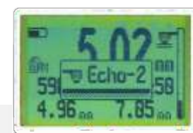
Cambio rápido de modo de medición, Normal o sobre pintura.